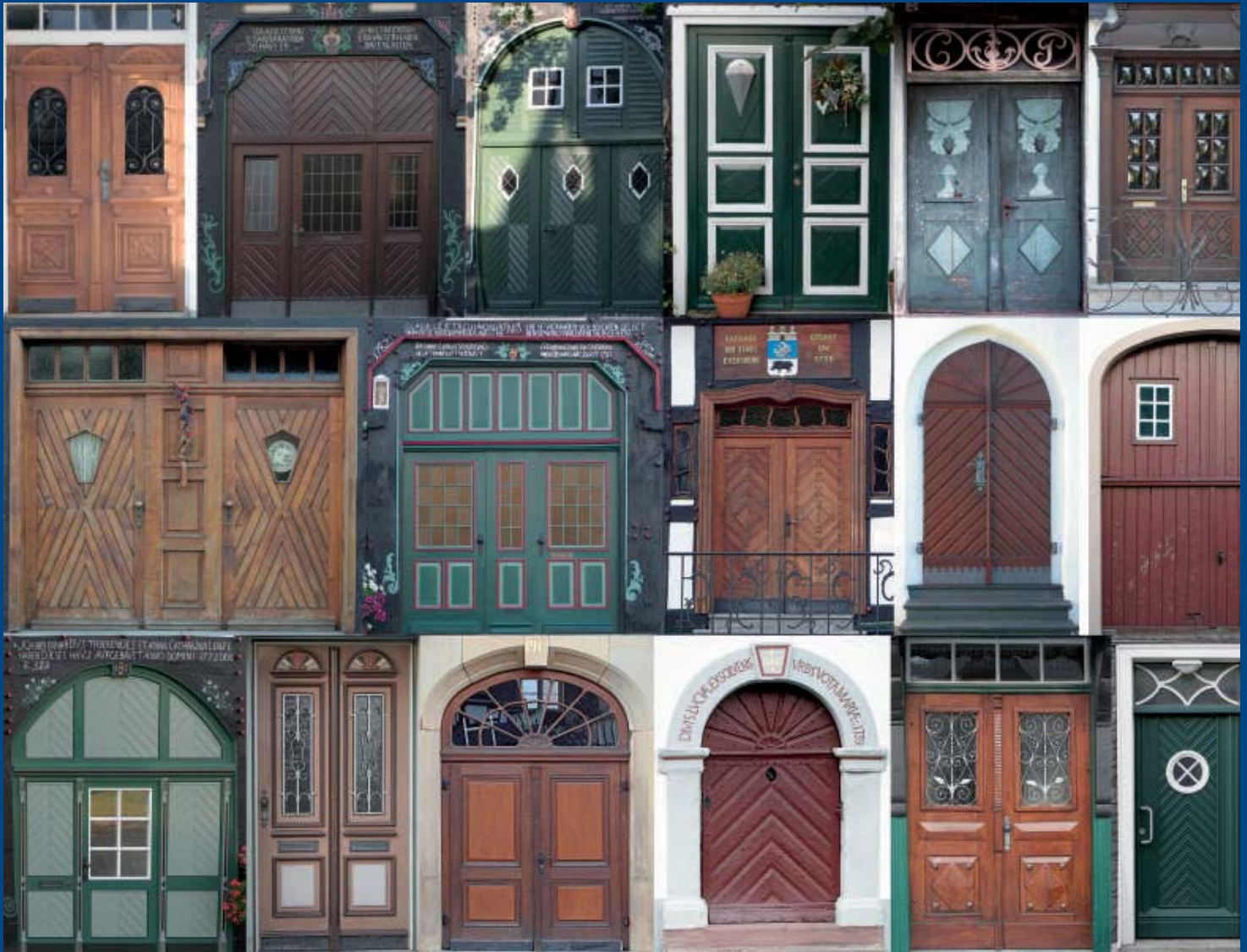
Ein Spaziergang entlang der Eversberger Türen und Tore