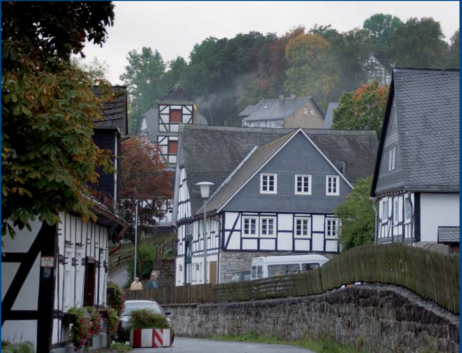
Erste Herbstboten in der Oststraße