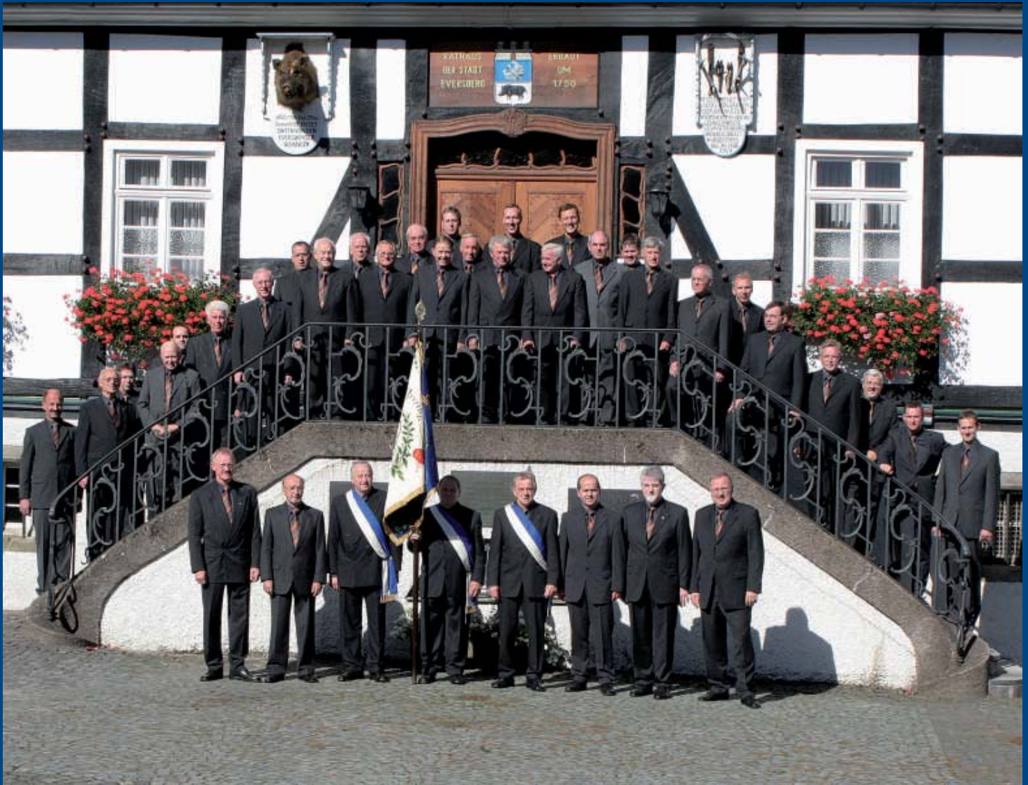
125 Jahre MGV „Concordia“ Eversberg: Herzlichen Glückwunsch!