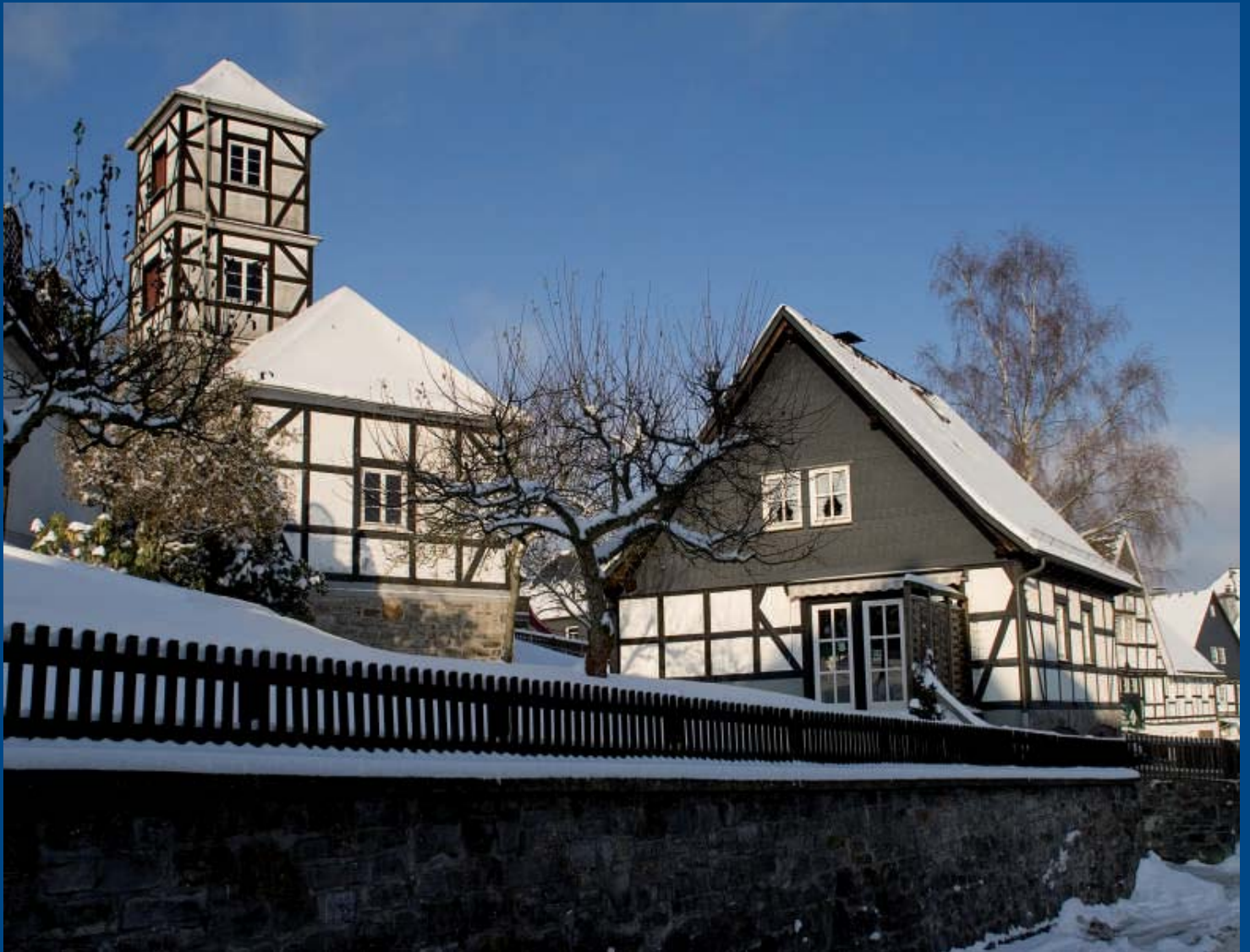
Strenger Winter am alten Feuerwehrrhaus