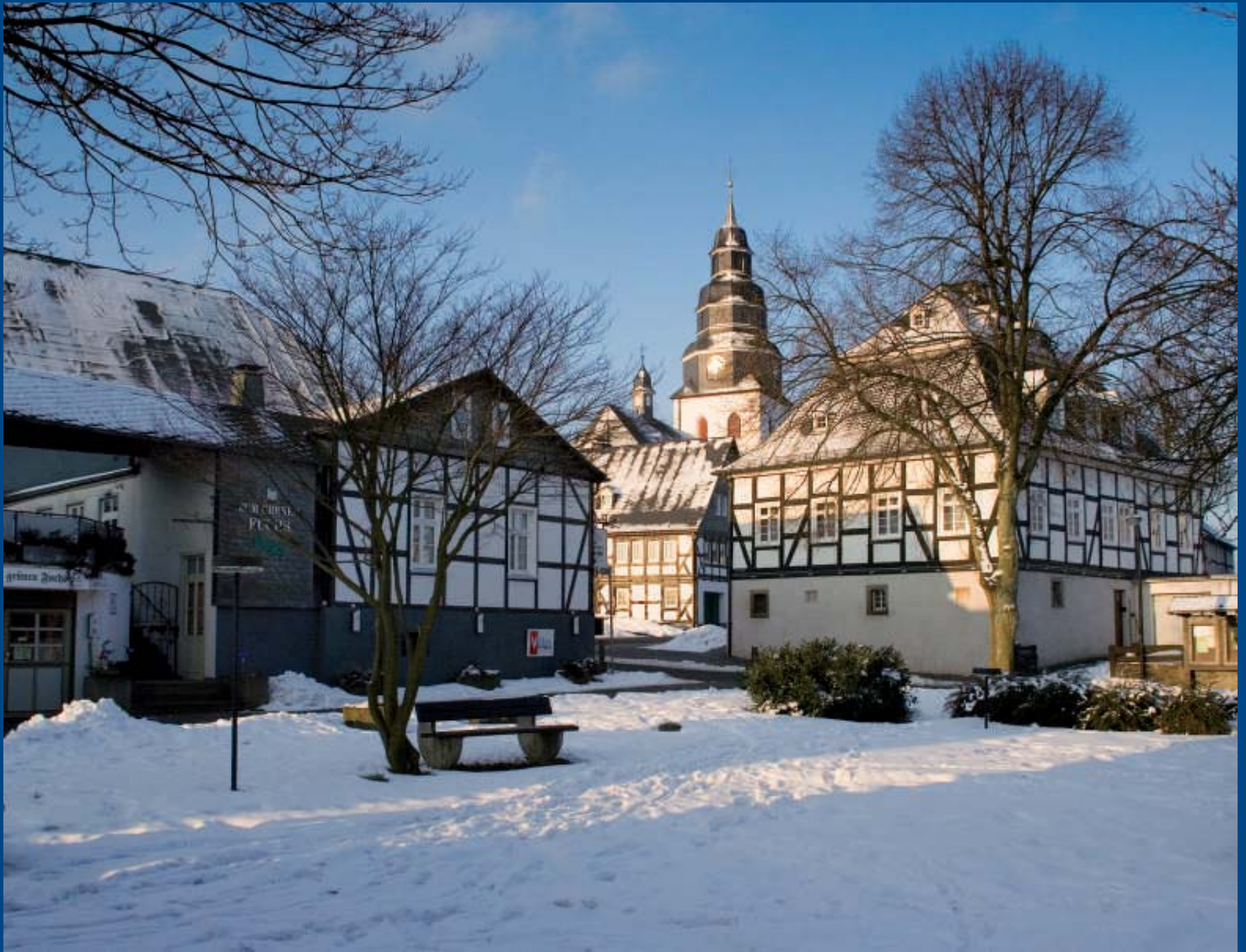
Winterlicher Blick vom Dr.-August-Pieper-Platz