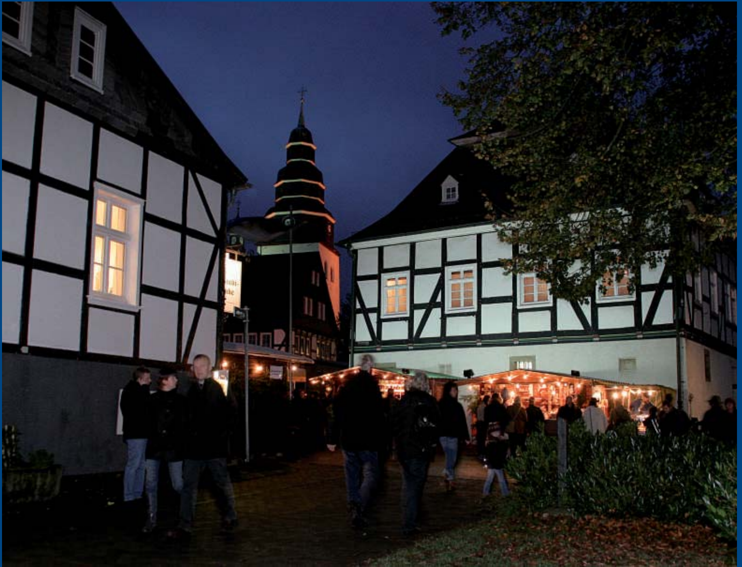
Altstadt-Flair beim Martinsmarkt