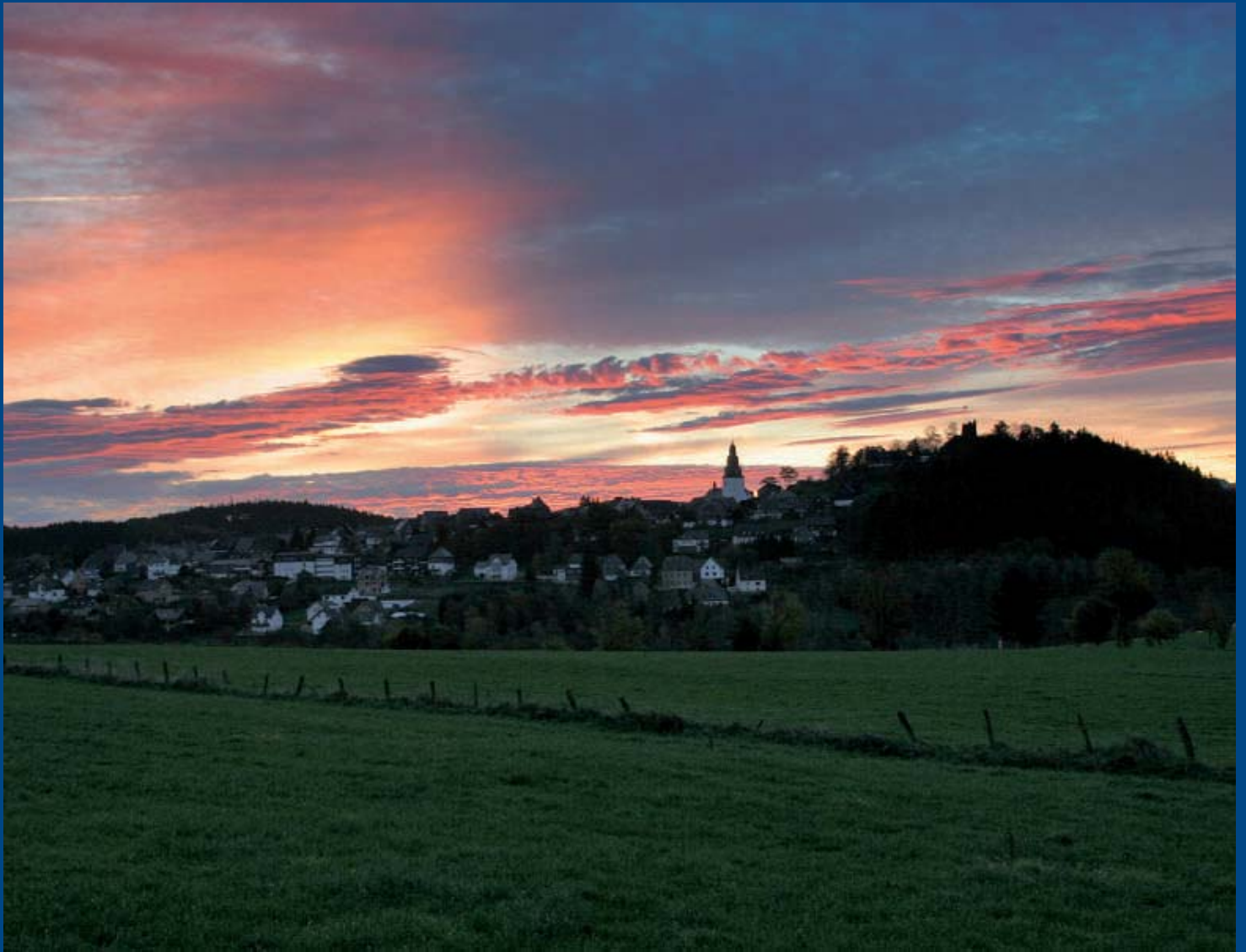
Grandioser Sonnenaufgang im Herbst