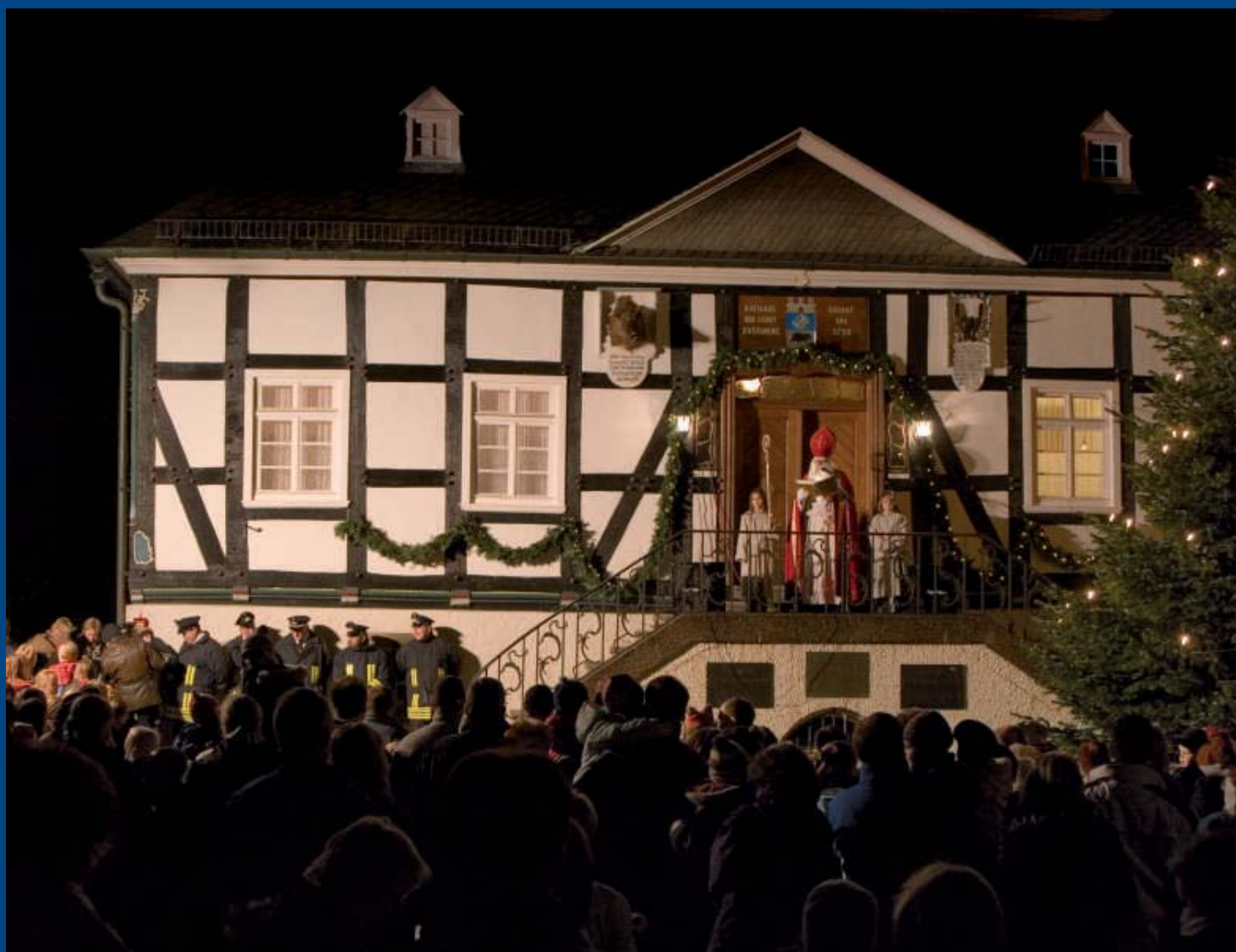
Vorweihnachtlicher Höhepunkt: Der Nikolaustag !