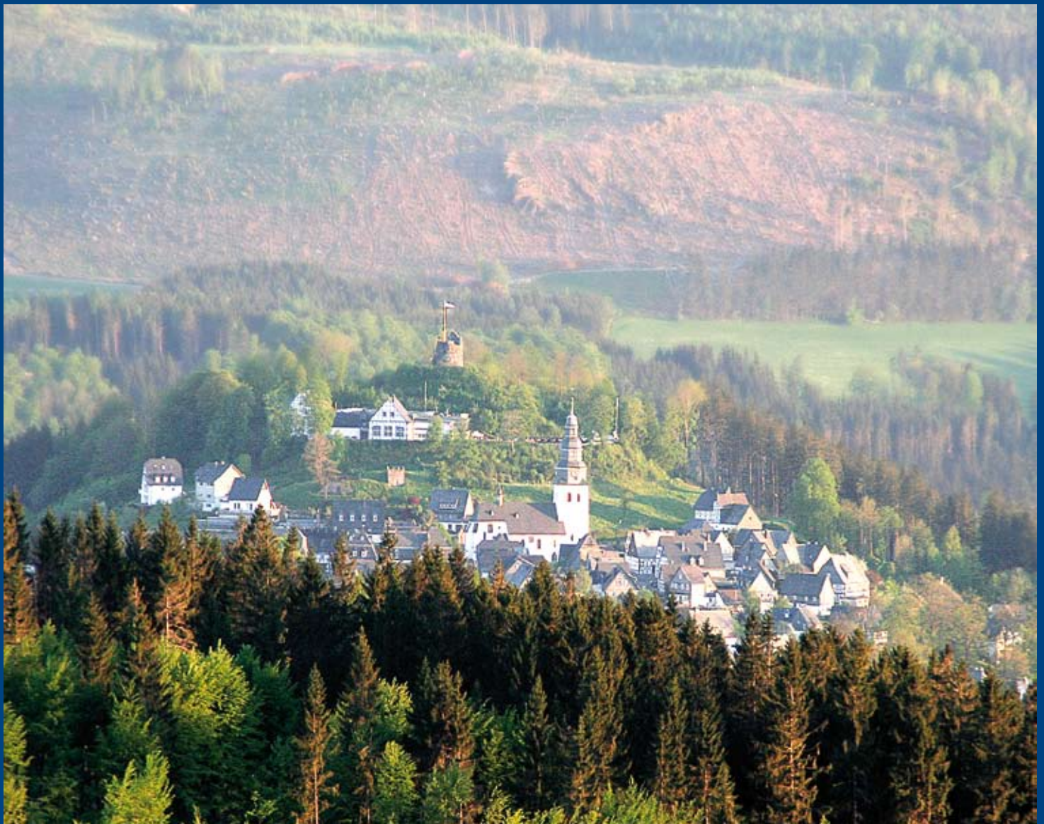
Blick vom Lörmeckerturm