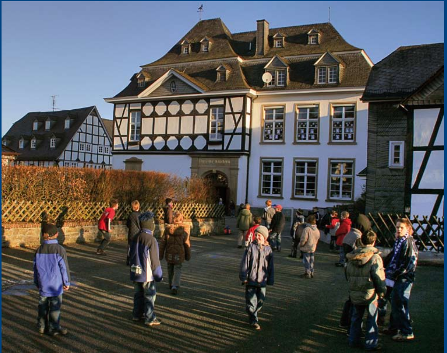
Spiel und Spaß auf dem Schulhof