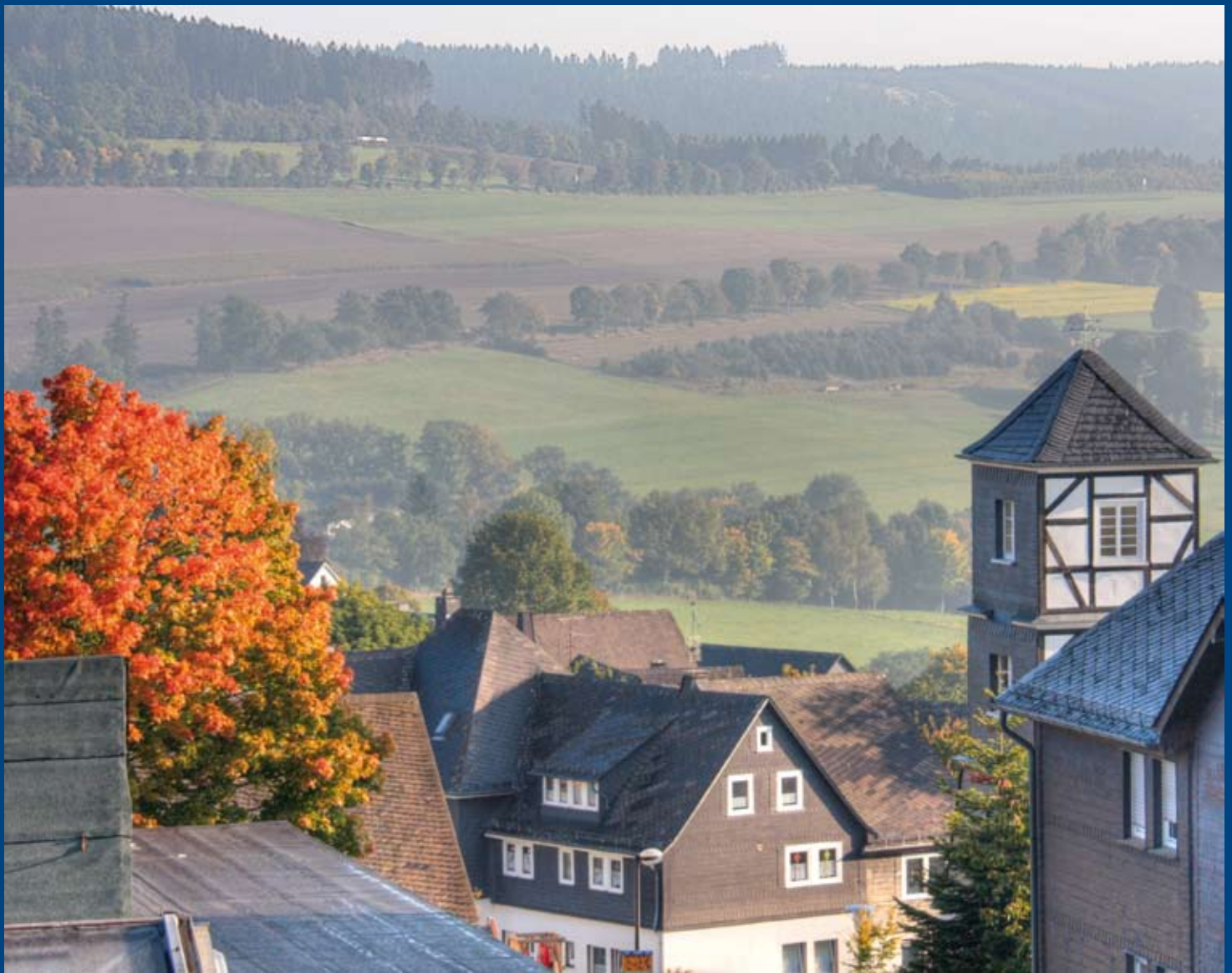
Herbstlicher Ausblick von der Altstadt bis zum „Kopf“