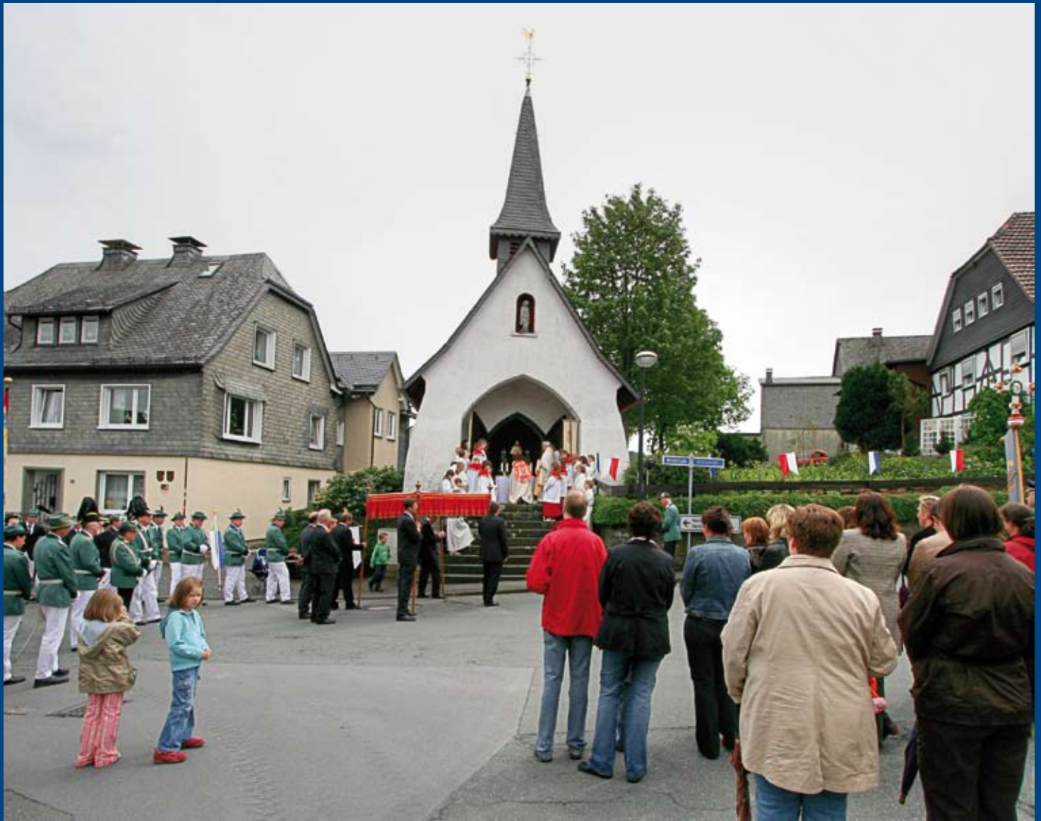
Rochuskapelle: Station bei der Großen Flurprozession