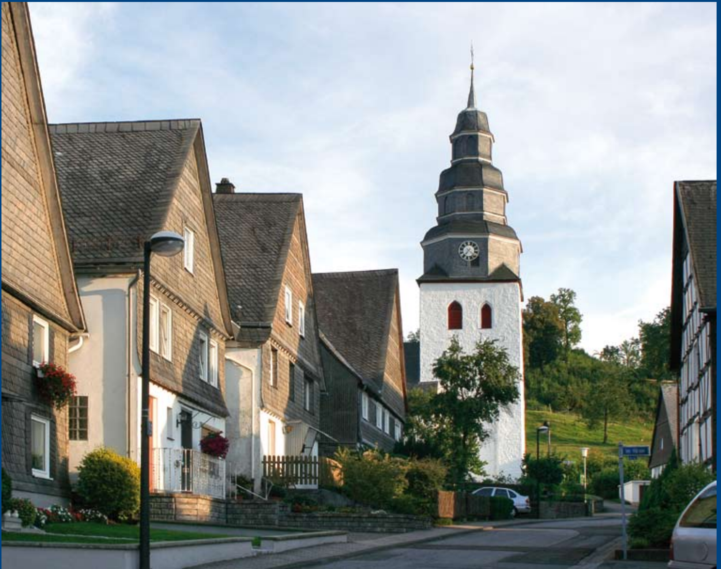
Sommerabend in der Weststraße