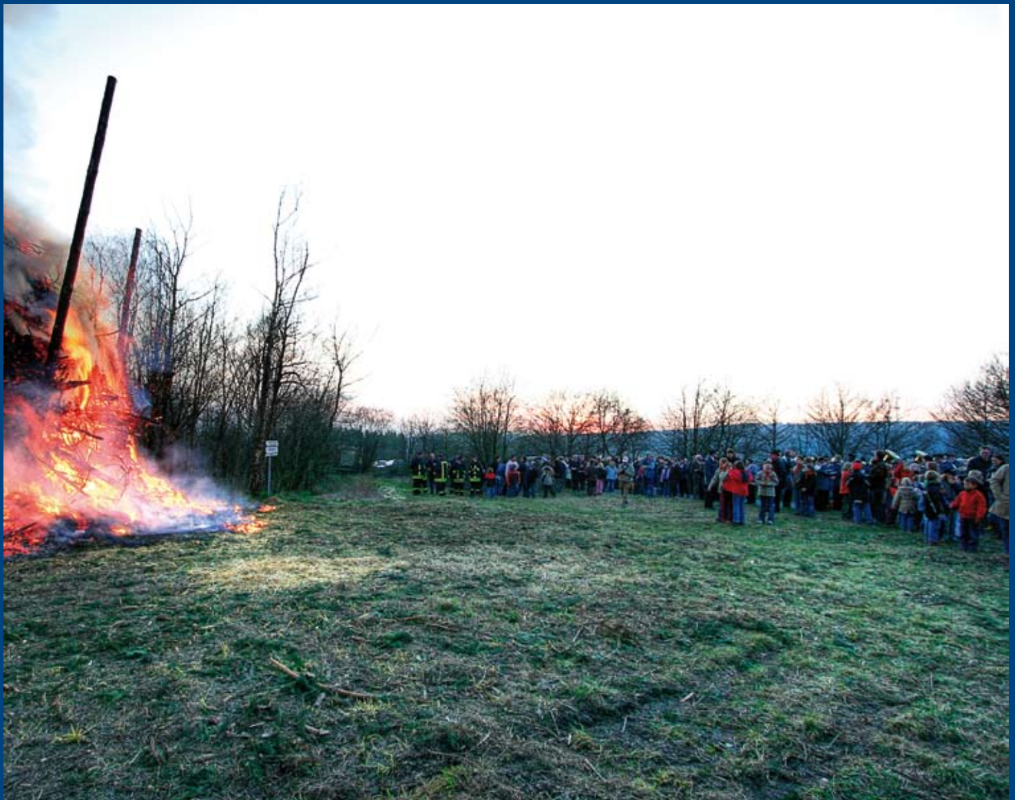
Österliche Stimmung vor der Wacholderheide