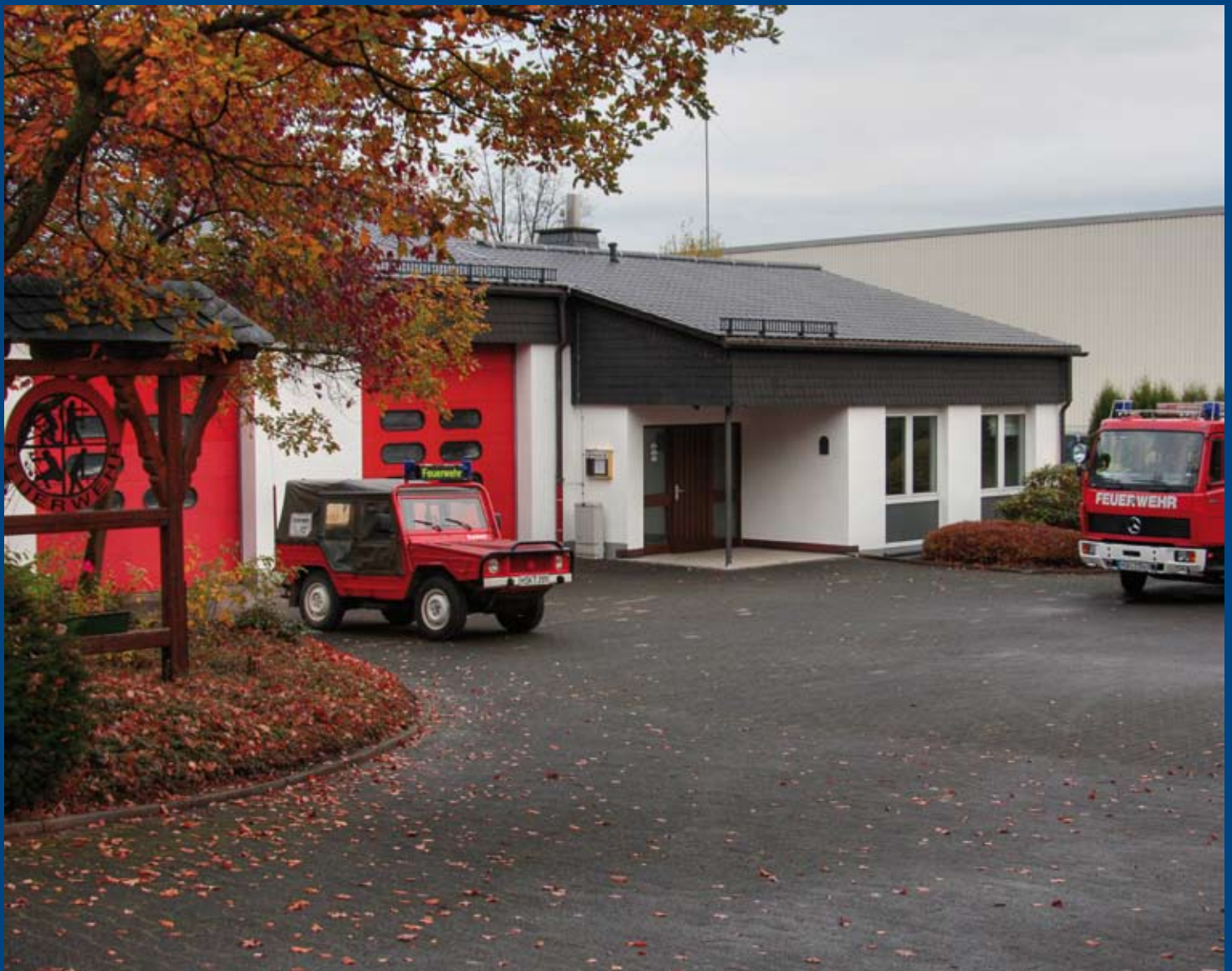
Seit 25 Jahren: Heimat der Feuerwehr