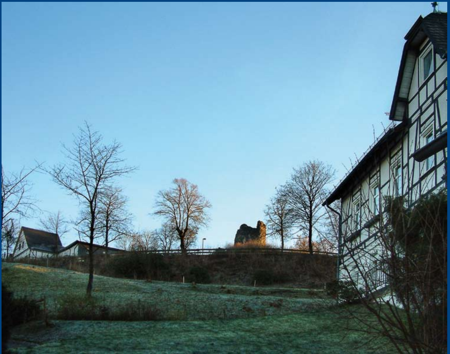
Eine seltene Perspektive: Schloßberghalle - Burgruine - Pfarrhaus