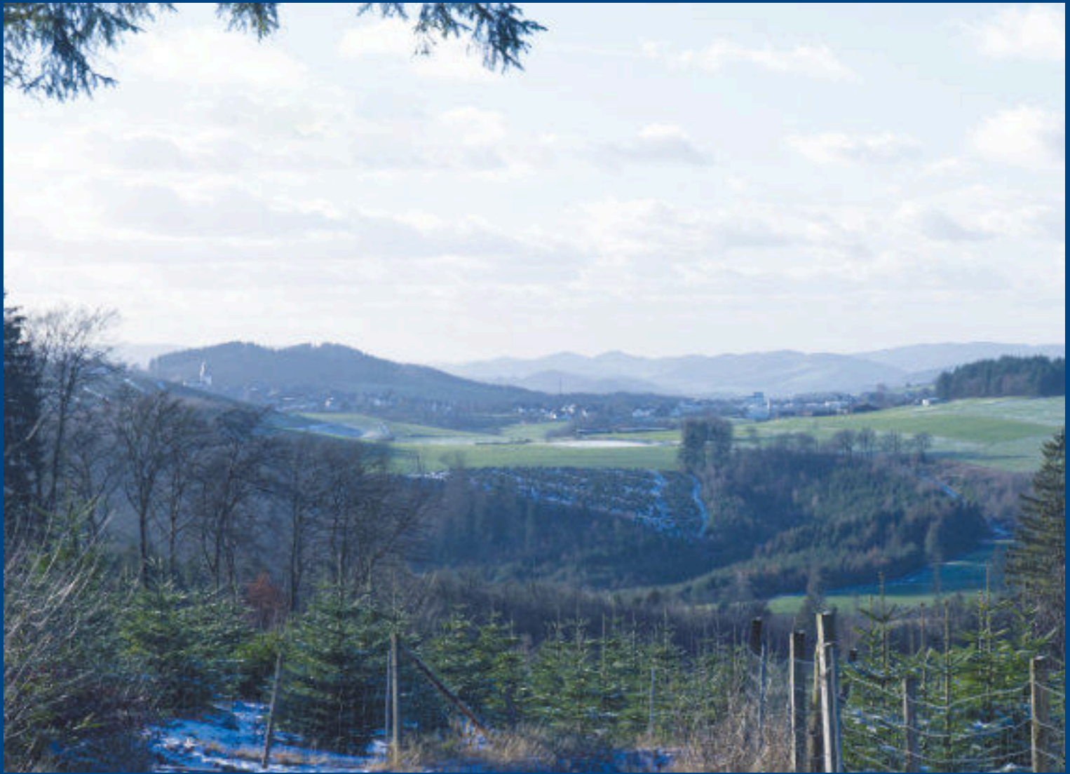
Winterwanderung von Föckinghausen nach Eversberg