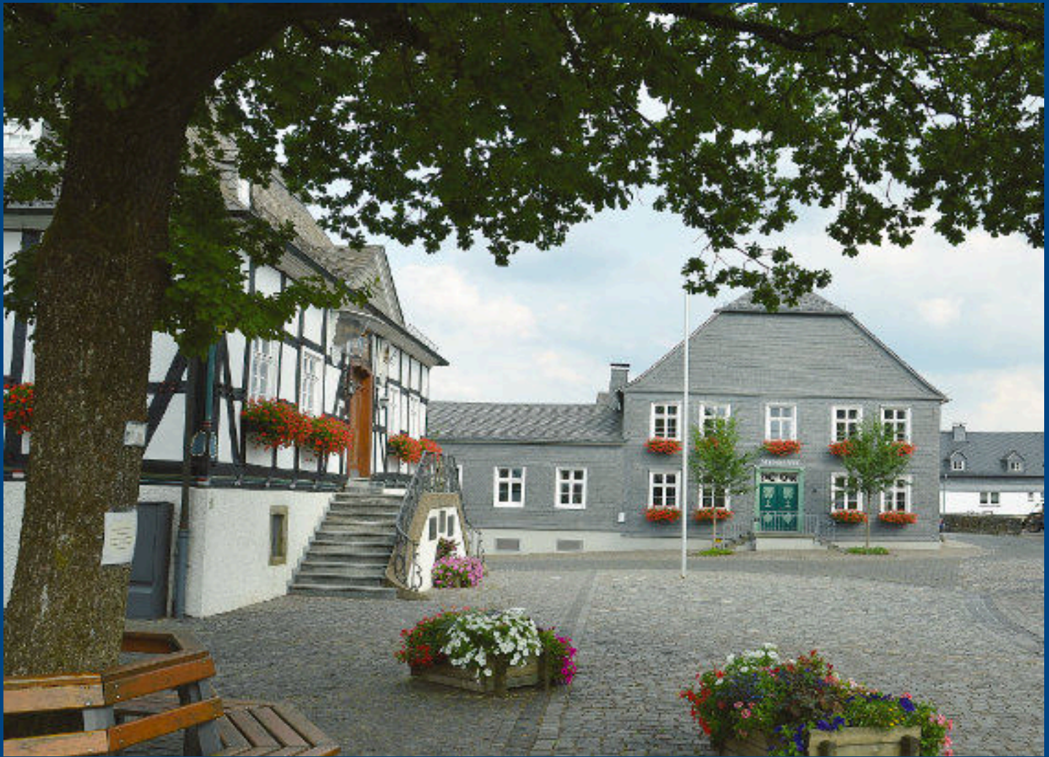
Marktplatz im bunten Blumenschmuck