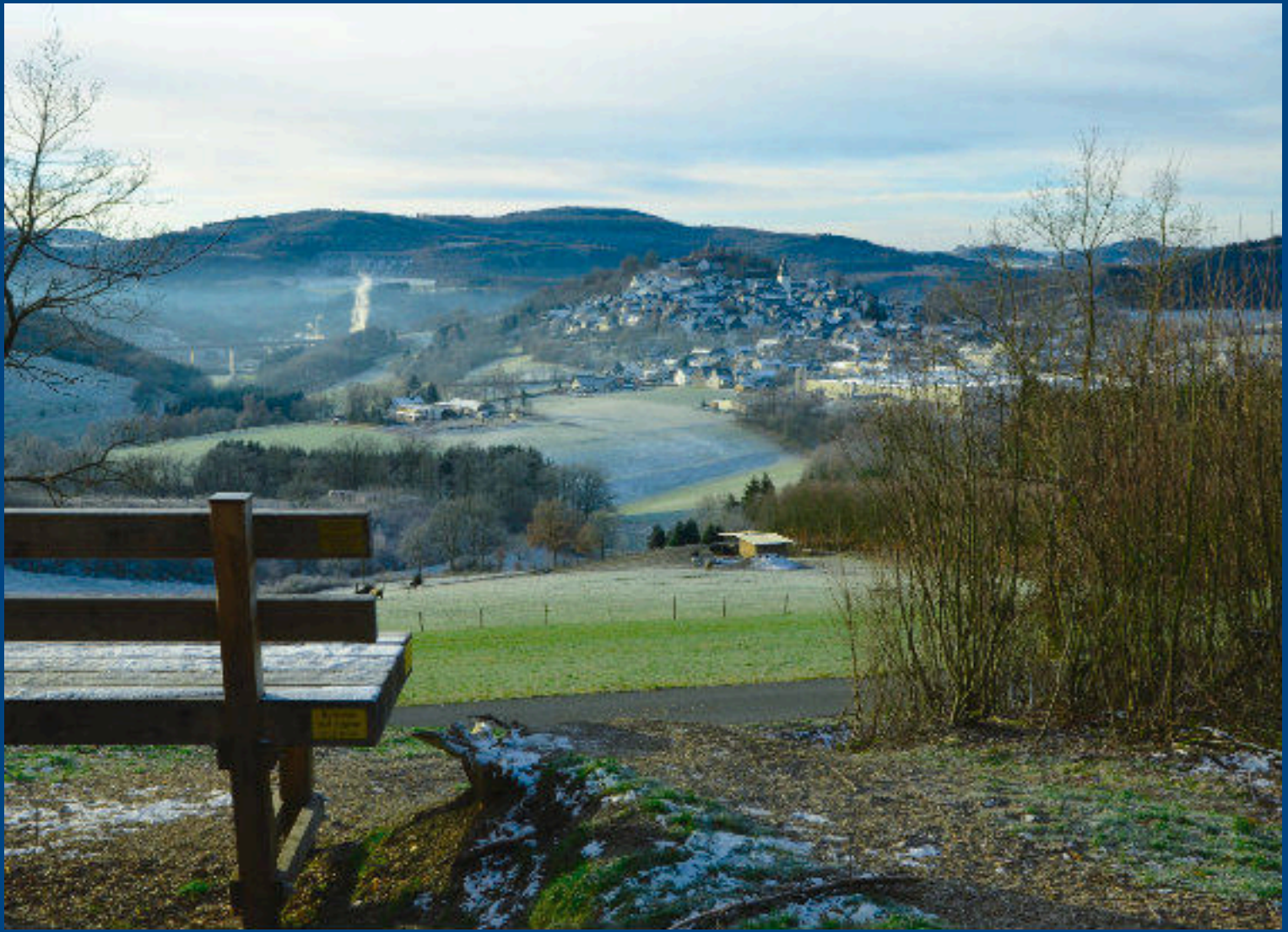
Wunderschöne Aussicht von der Hochbank am Sonnenweg