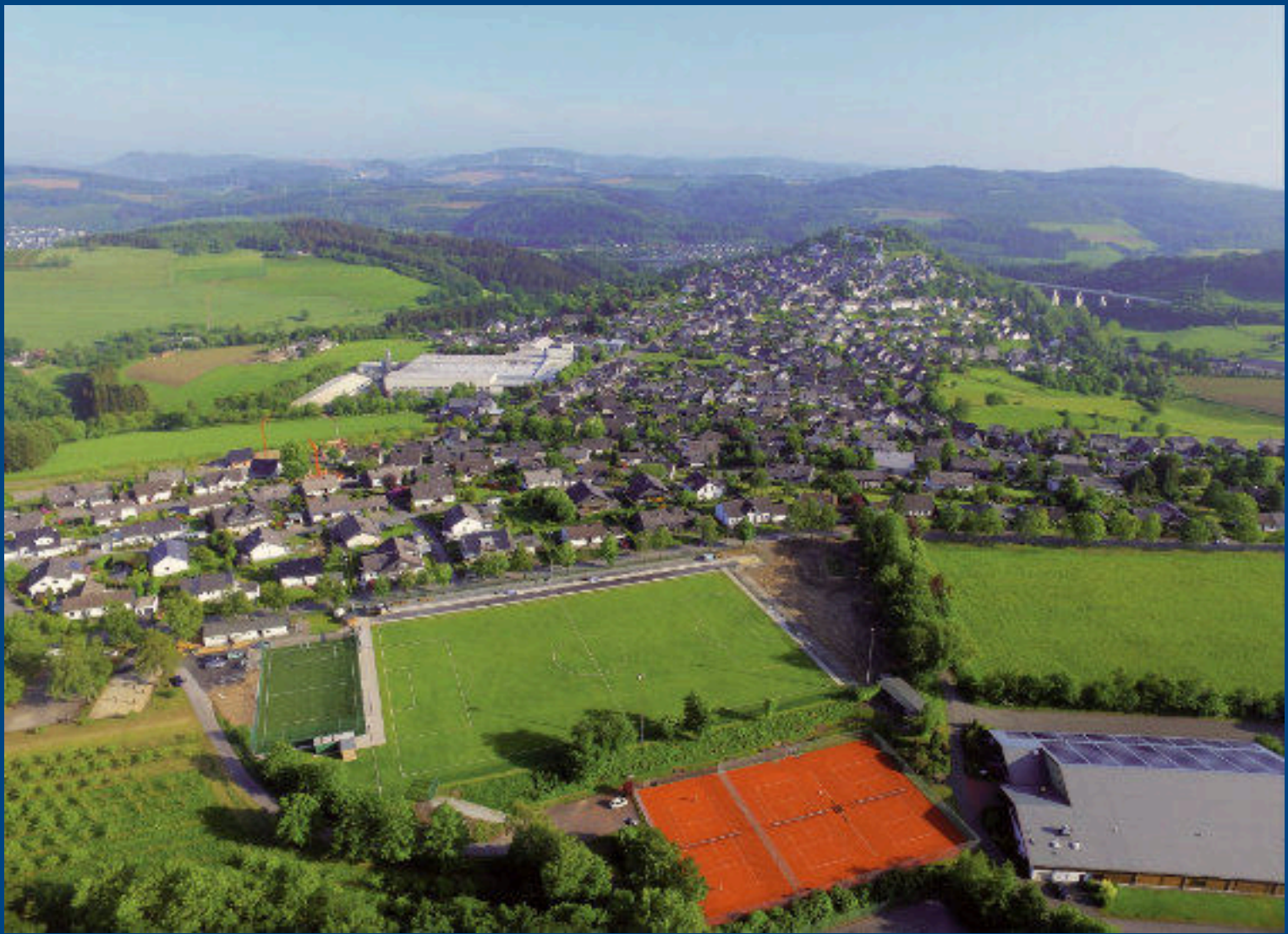
Bergstadt im 'Land der tausend Berge'