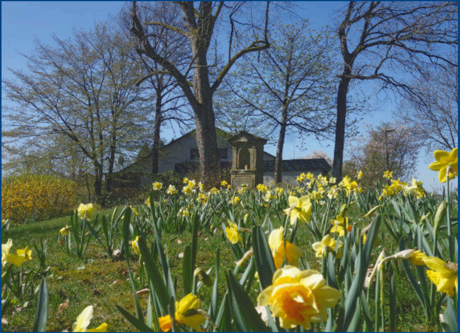
Ostern auf der Buchsplitt