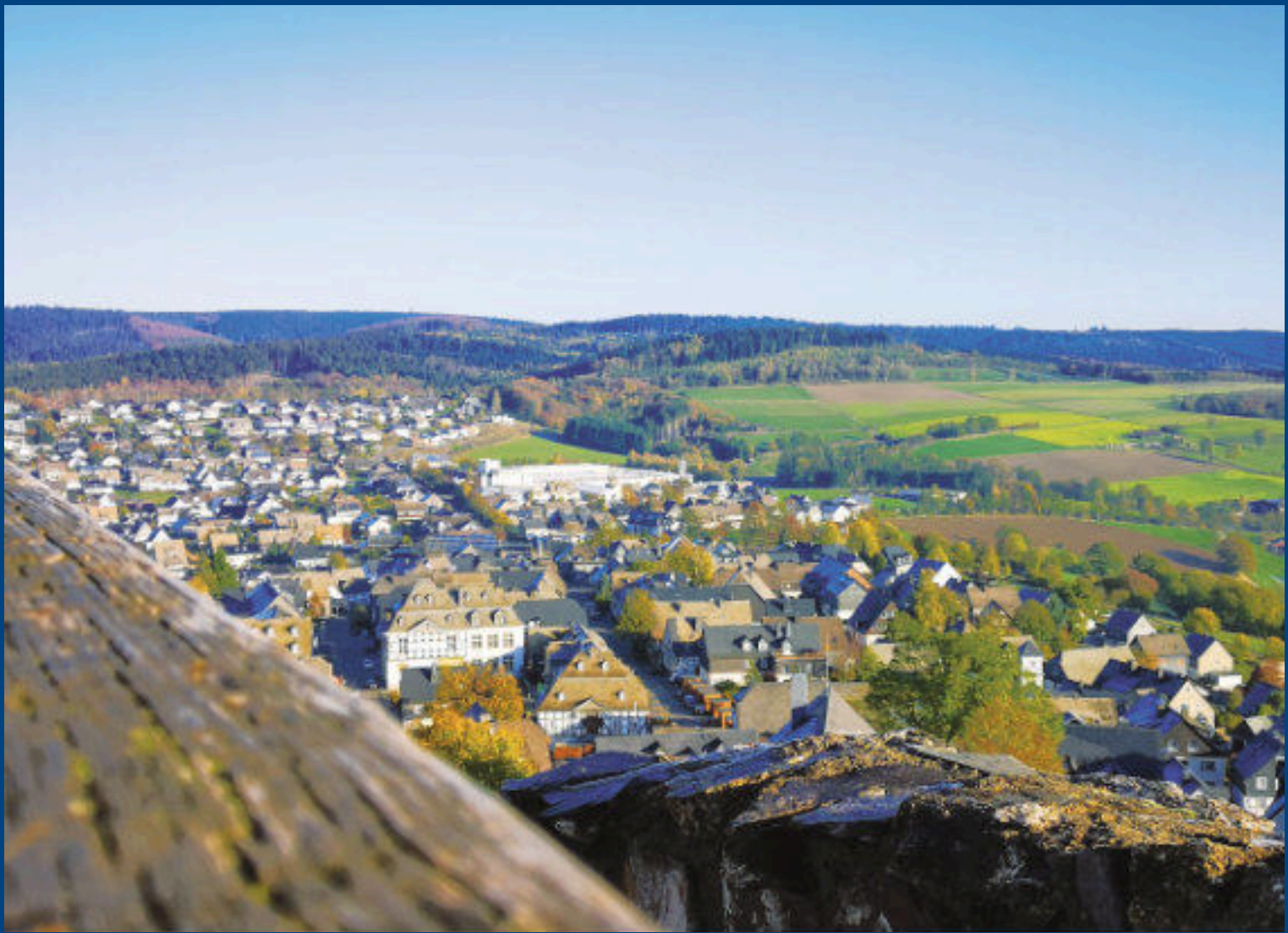
Beginnender Herbst: Blick von der Burgruine