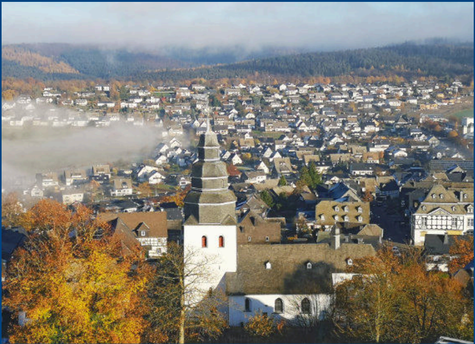
Die Sonne verdrängt den Novembernebel