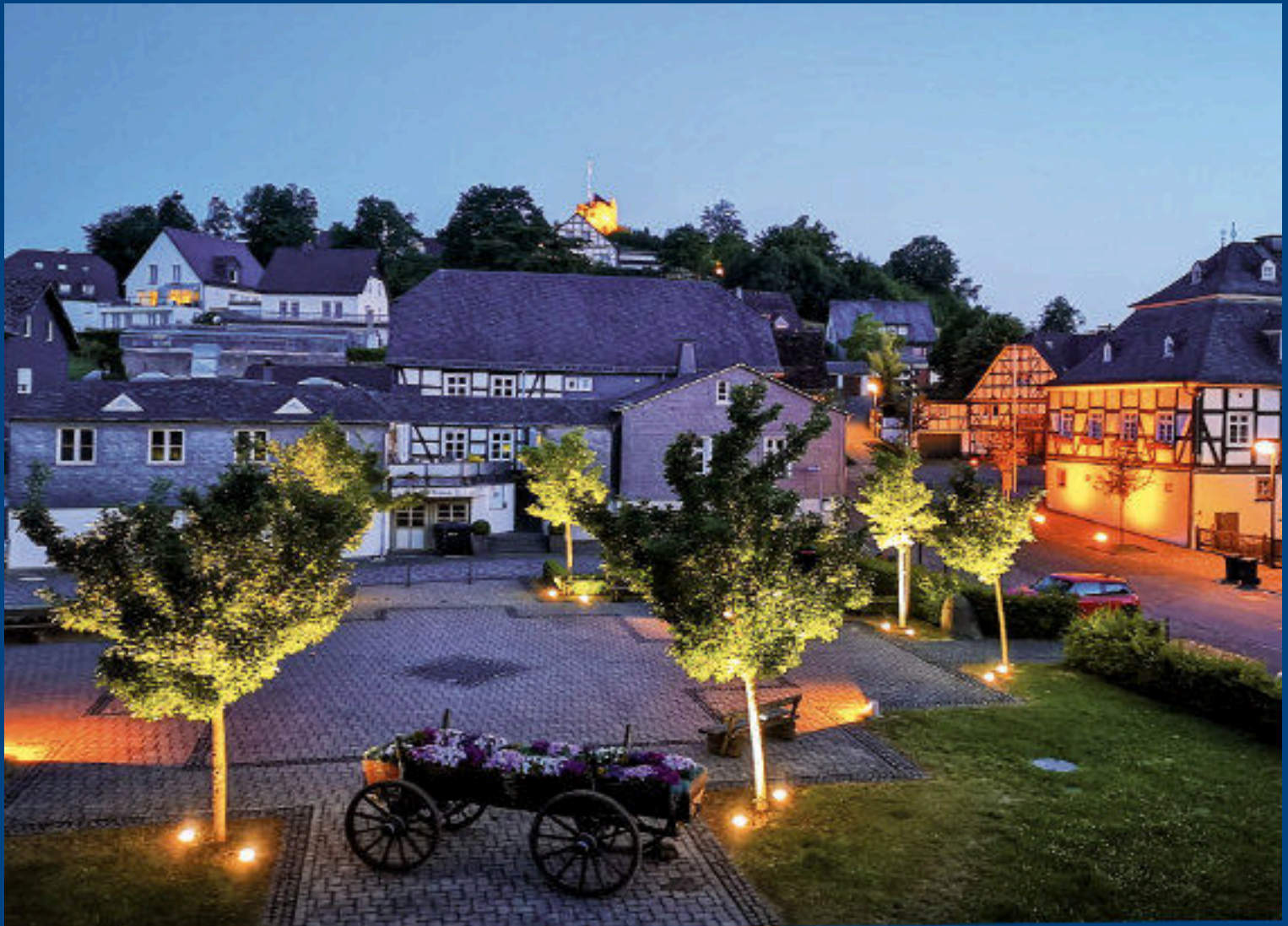
Abendstimmung im Sommer