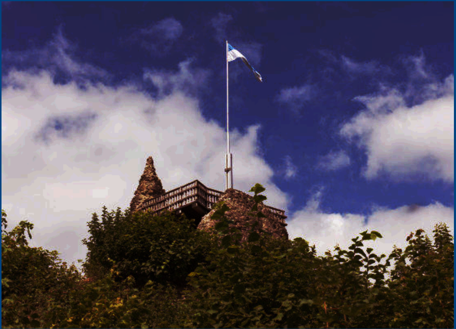
Schützenfest am Fuß der Burgruine