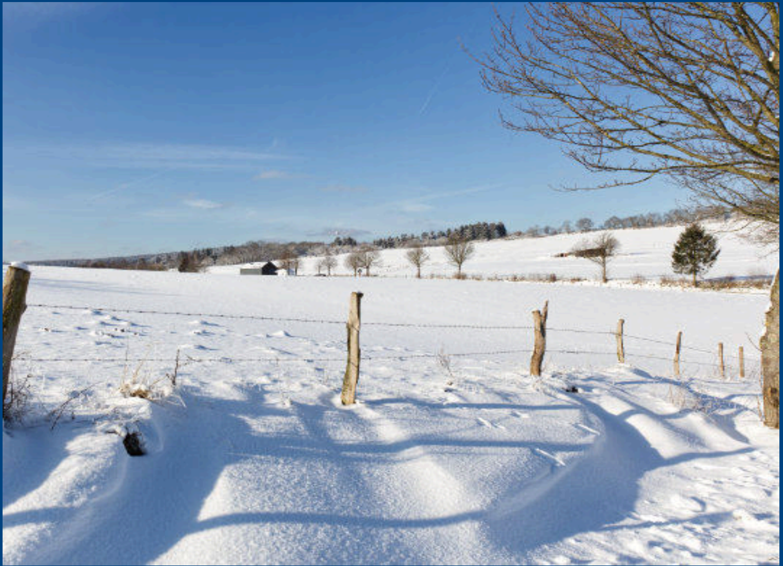
Winterlandschaft an der Lingscheider Kapelle